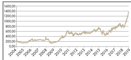
Kursentwicklung Palladium 999,5 in €

Die aktuellen Kursentwicklungen finden Sie hier: www.sutorbank.de/edelmetallkurse