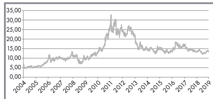
Kursentwicklung Silber 999 in €