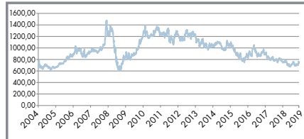
Kursentwicklung Platin 999,5 in €