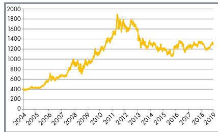
Kursentwicklung Feingold 999,9 in $